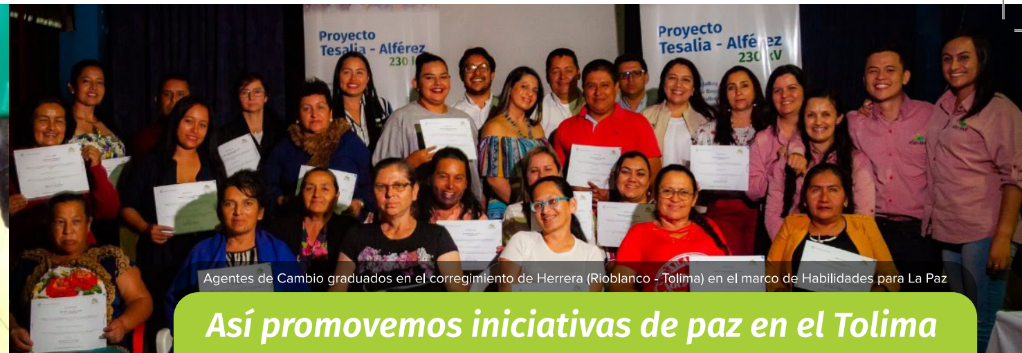
Agentes de Cambio graduados en el corregimiento de Herrera (Rioblanco - Tolima) en el marco de Habilidades para La Paz

Son plantas que viven sobre los árboles, sin embargo, no les causan daño. Éstas promueven la biodiversidad en los bosques y son importantes ya que generan oxígeno, sirven de hábitat a otros seres vivos, se convierten en “Oasis” en tiempos de sequía, tienen múltiples interacciones con animales y cuando ellas mueren, son las que enriquecen los suelos con nutrientes para nuevas plantas del bosque