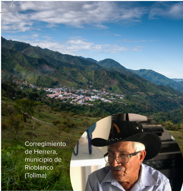
Corregimiento de Herrera, municipio de Rioblanco (Tolima)