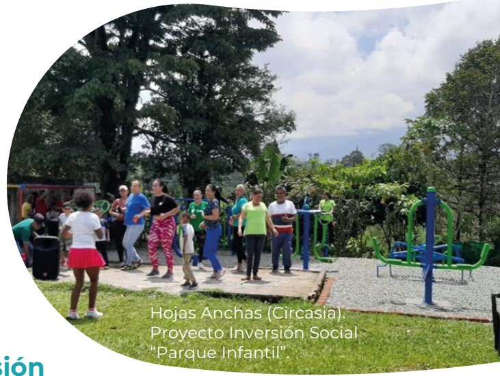
Hojas Anchas (Circasia), Proyecto Inversión Social "Parque Infantil".

La ejecución de los proyectos de inversión social se ha dado gracias a las alianzas estratégicas realizadas con actores reconocidos en el territorio, como la administración municipal de Pereira , a través de la Secretaría de Infraestructura y también, la suscripción del convenio con La Corporación Grupo Gestión .