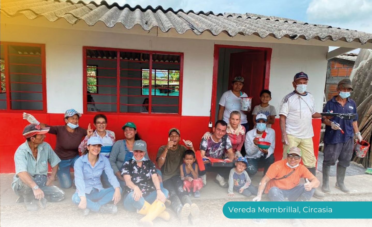
Vereda Membrillal, Circasia

Con el fin de fortalecer el relacionamiento con las comunidades y mantener una adecuada comunicación con las mismas, hemos realizado diferentes acciones para: