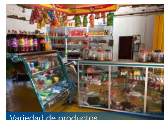
Variedad de productos