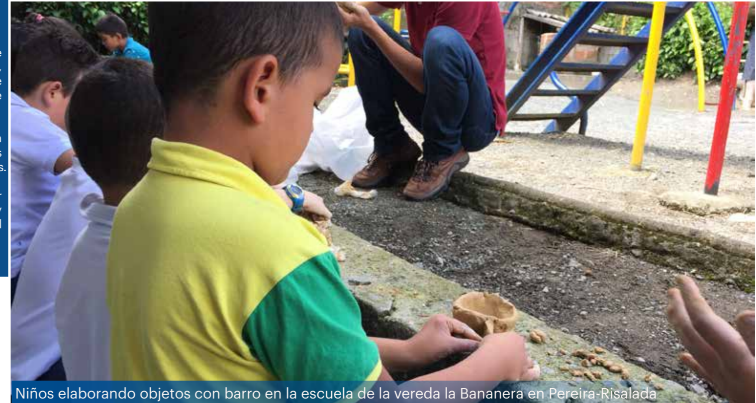
Niños elaborando objetos con barro en la escuela de la vereda la Bananera en Pereira-Risaralda

Mediante una socialización con la comunidad, El Grupo Energía de Bogotá (GEB) ha dado a conocer el hallazgo de dos Tumbas de Cancel.