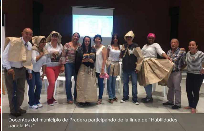
Docentes del municipio de Pradera participando de la línea de “Habilidades para la Paz”