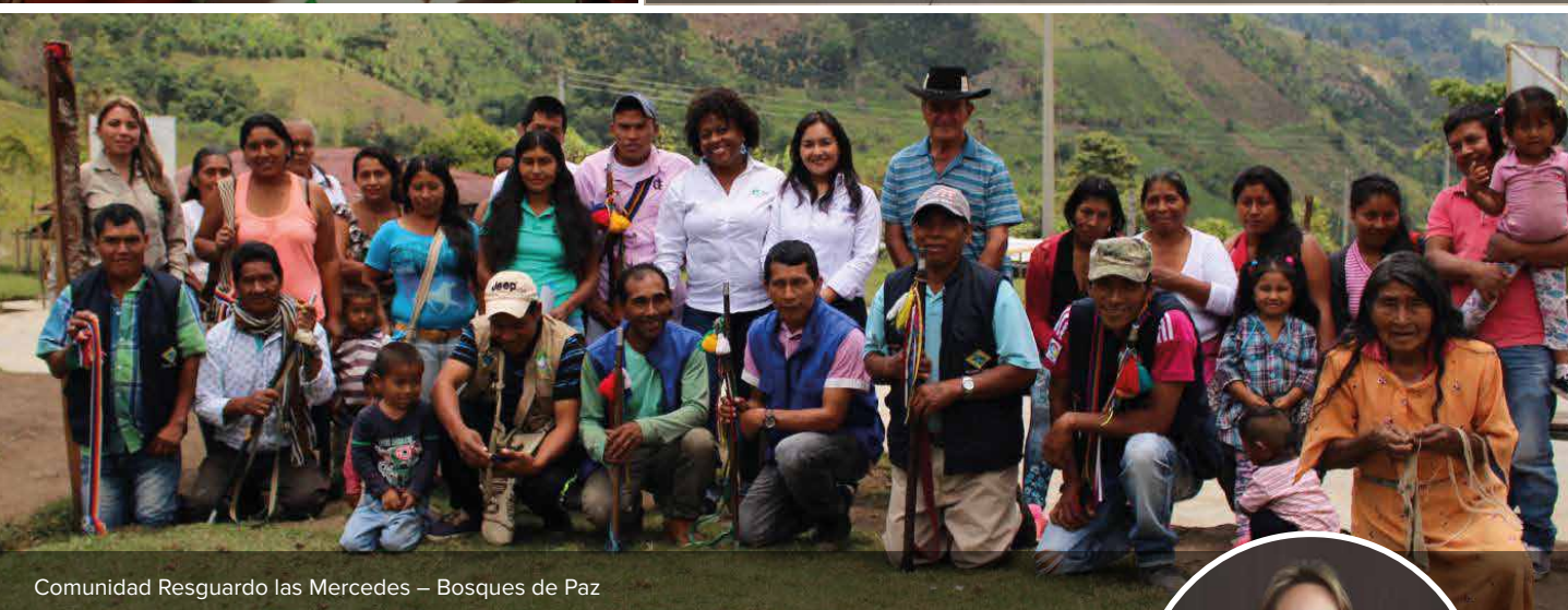
Comunidad Resguardo las Mercedes – Bosques de Paz