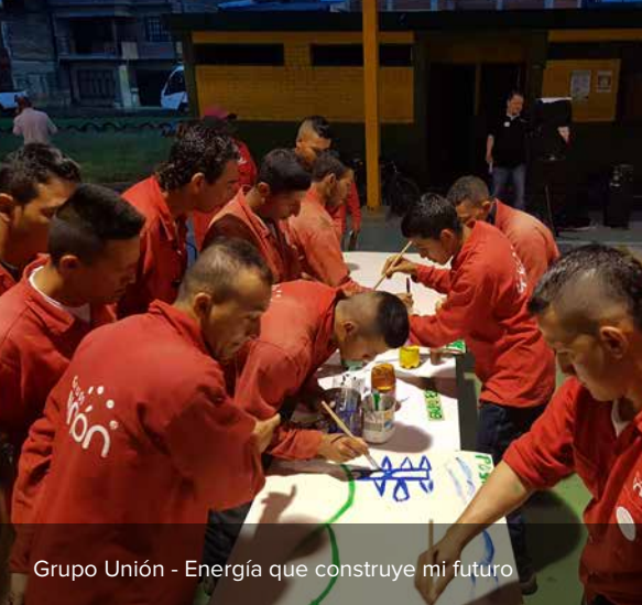
Grupo Unión - Energía que construye mi futuro