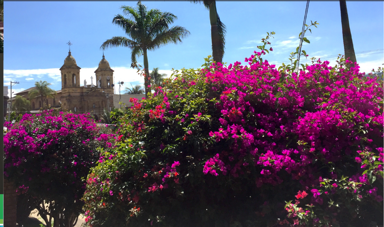
Vista desde la plaza de mercado a la iglesia Nuestra Señora de la Candelaria, Machetá-Cundinamarca.

Continuando con el proceso de licenciamiento ambiental del proyecto UPME 03-2010 Norte-Chivor II, el Grupo Energía Bogotá -GEB- viene adelantando diferentes acciones encaminadas al cuidado y la protección del medio ambiente.