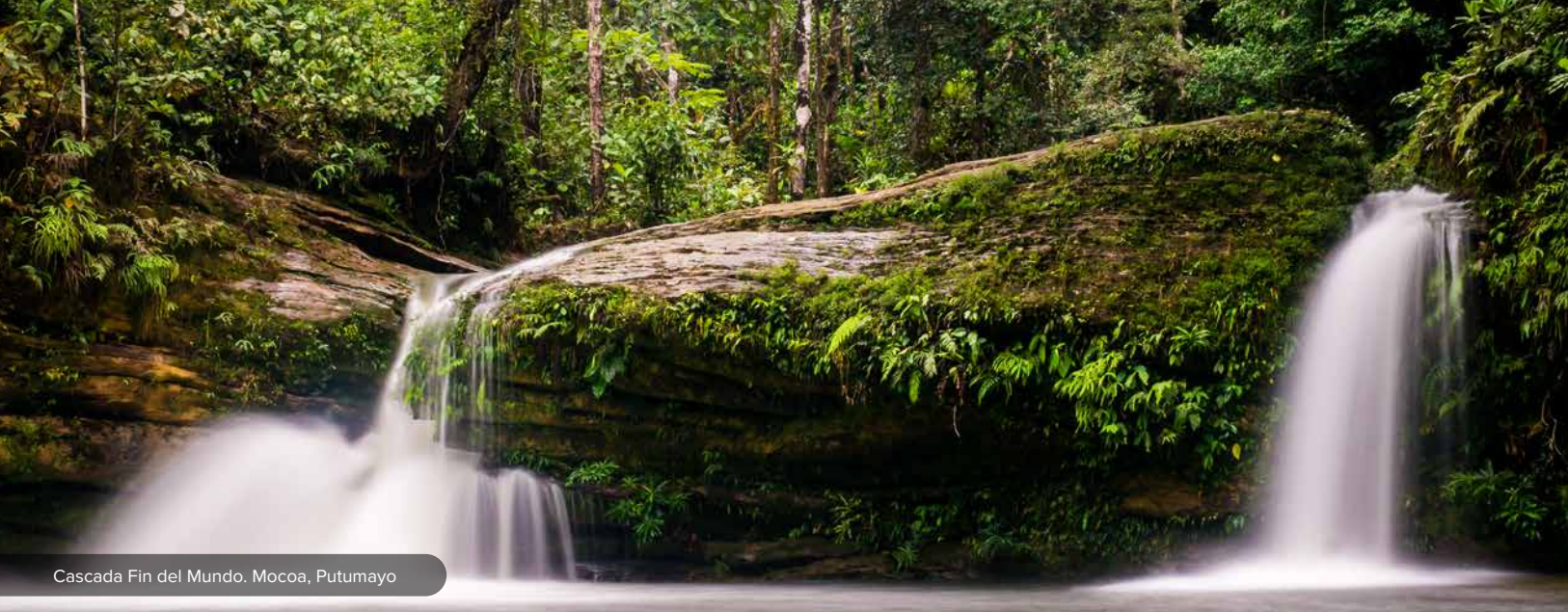
Cascada Fin del Mundo. Mocoa, Putumayo