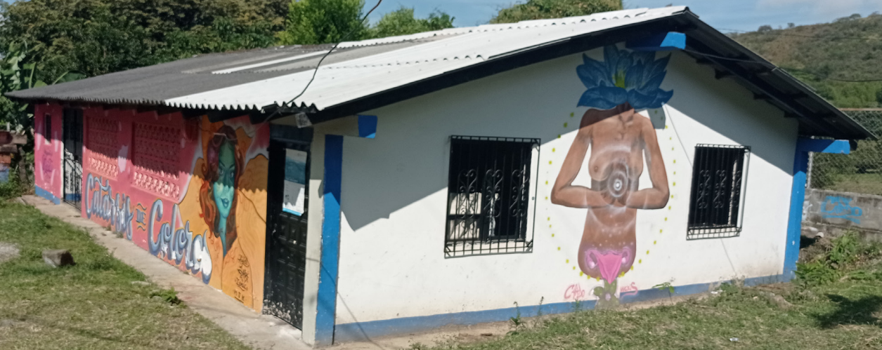
Mejoramiento de caseta comunal Potrerito en el municipio de Pradera, Valle del Cauca