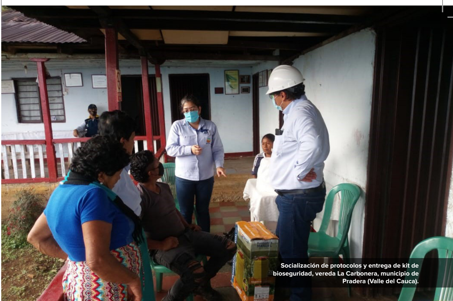
Socialización de protocolos y entrega de kit de bioseguridad, vereda La Carbonera, municipio de Pradera (Valle del Cauca).