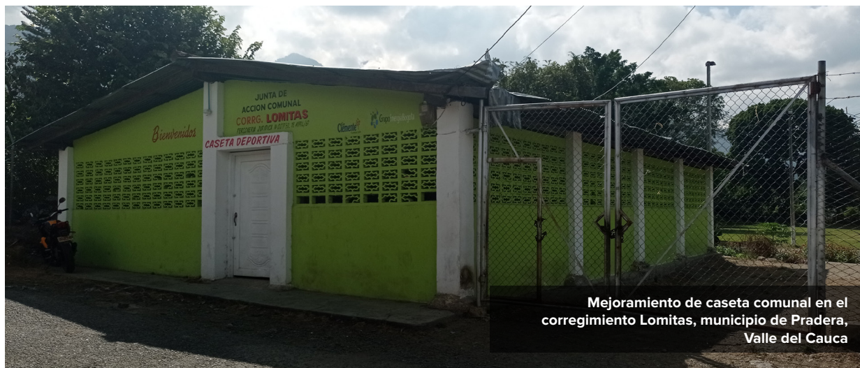
Mejoramiento de caseta comunal en el corregimiento Lomitas, municipio de Pradera, Valle del Cauca