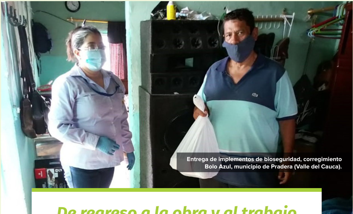
Entrega de implementos de bioseguridad, corregimiento Bolo Azul, municipio de Pradera (Valle del Cauca).