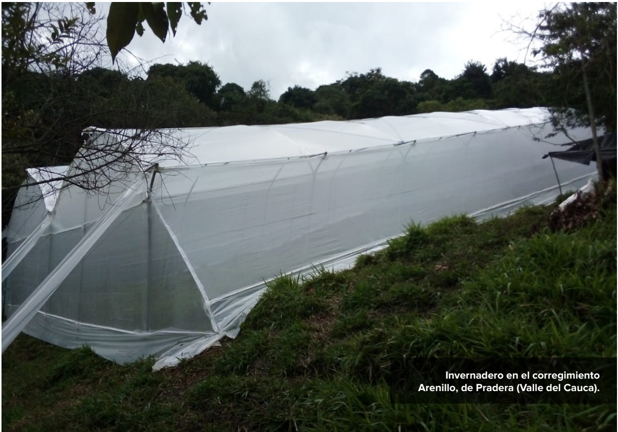
Invernadero en el corregimiento Arenillo, de Pradera (Valle del Cauca).

Para esta zona del Valle del Cauca, explicó Garay, se priorizaron 23 iniciativas, de las cuales ya se ejecutaron 17 .