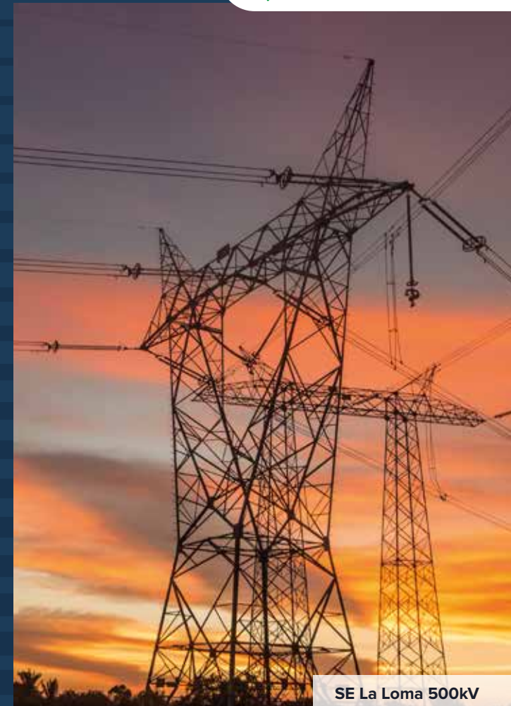
SE La Loma 500kV