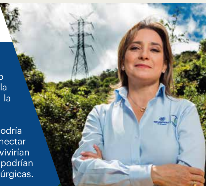
Astrid Álvarez Presidente GEB

Sin embargo, para alcanzar este objetivo debemos trabajar todos de la mano . Es necesario el apoyo del gobierno, del sector privado, pero muy especialmente de las comunidades. Si no hay un trabajo en conjunto será muy difícil mejorar la calidad de vida de los habitantes que han estado marginados del progreso. Y la energía eléctrica es un paso para comenzar a superar ese atraso.